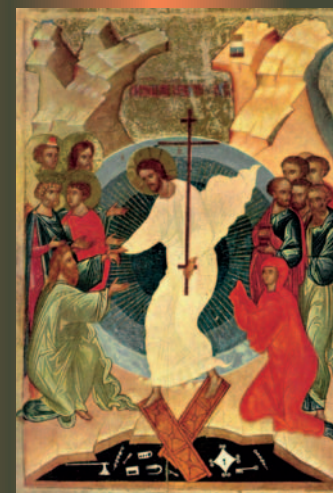
"Discesa agli Inferi" - Scuola di Novgorod, XV secolo